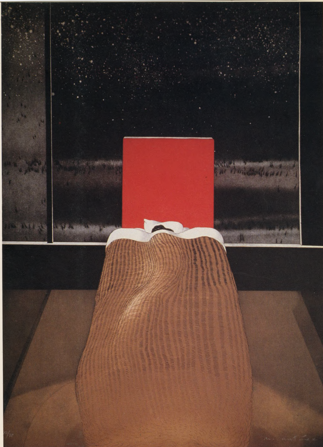
"Cama en la ciudad". 1986