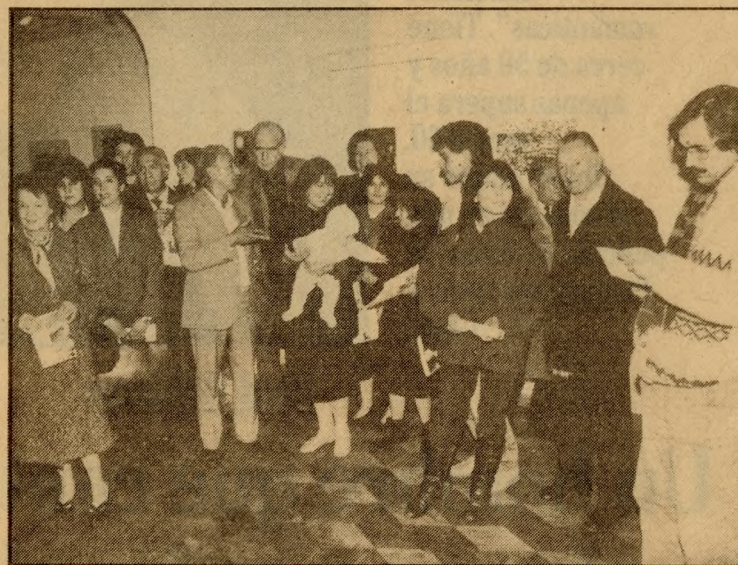
Artistas y amigos, muchos de ellos de Tomé, asistieron a la inauguración.