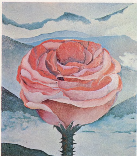
Rodrigo Callejas Rosa - repollo - Colombia