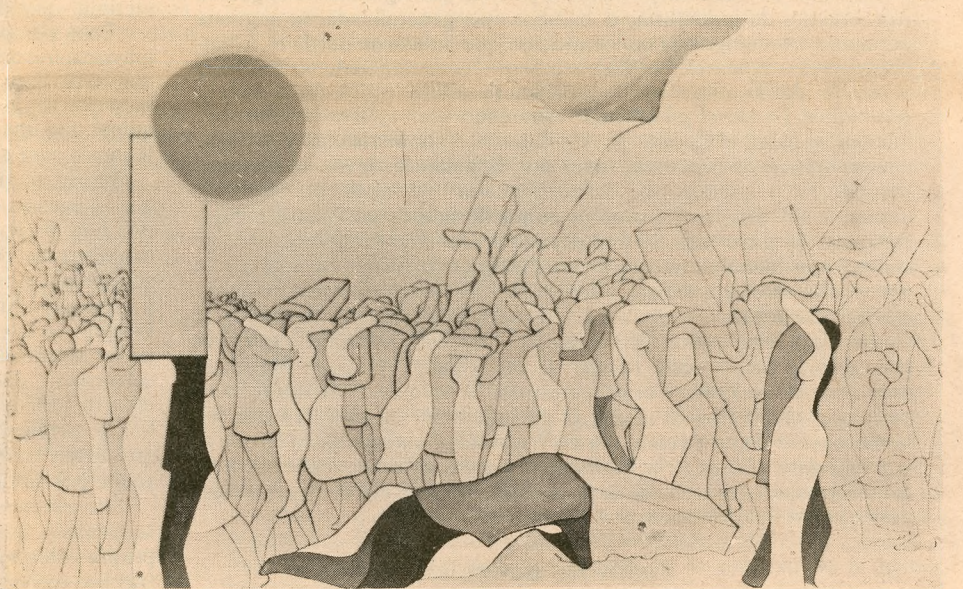
"Tanguera II", goache, tinta china. Londres 81 "Neruda en su lluvia", acuarela. Londres 1980

profesión es importante. Entonces, afortunadamente, obtuve una beca Fullbright y me fui a la Universidad de Colombia en Nueva York donde viví doce años.