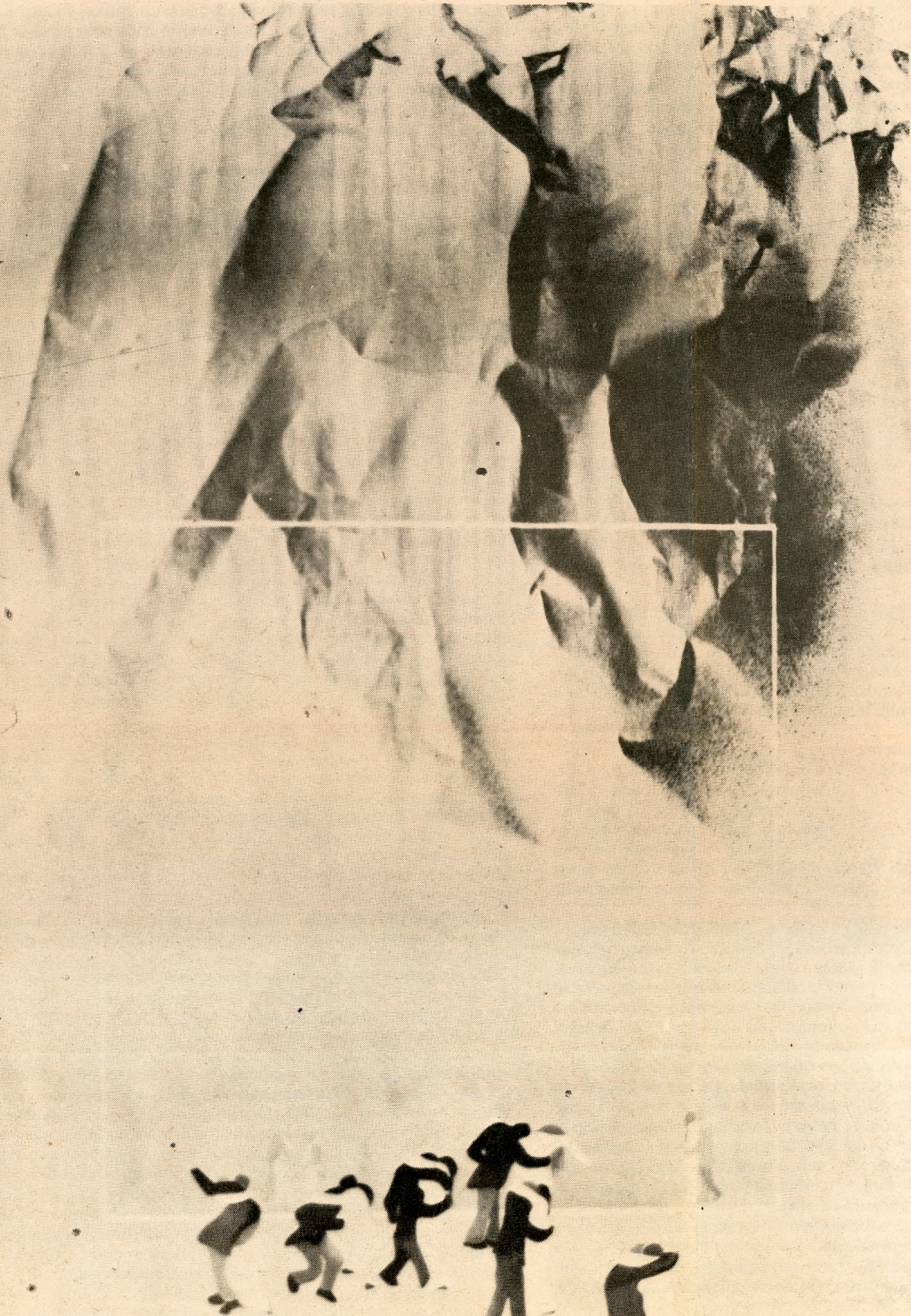
"Tango en la Cordillera", Londres 1980.- acuarela, t mpera