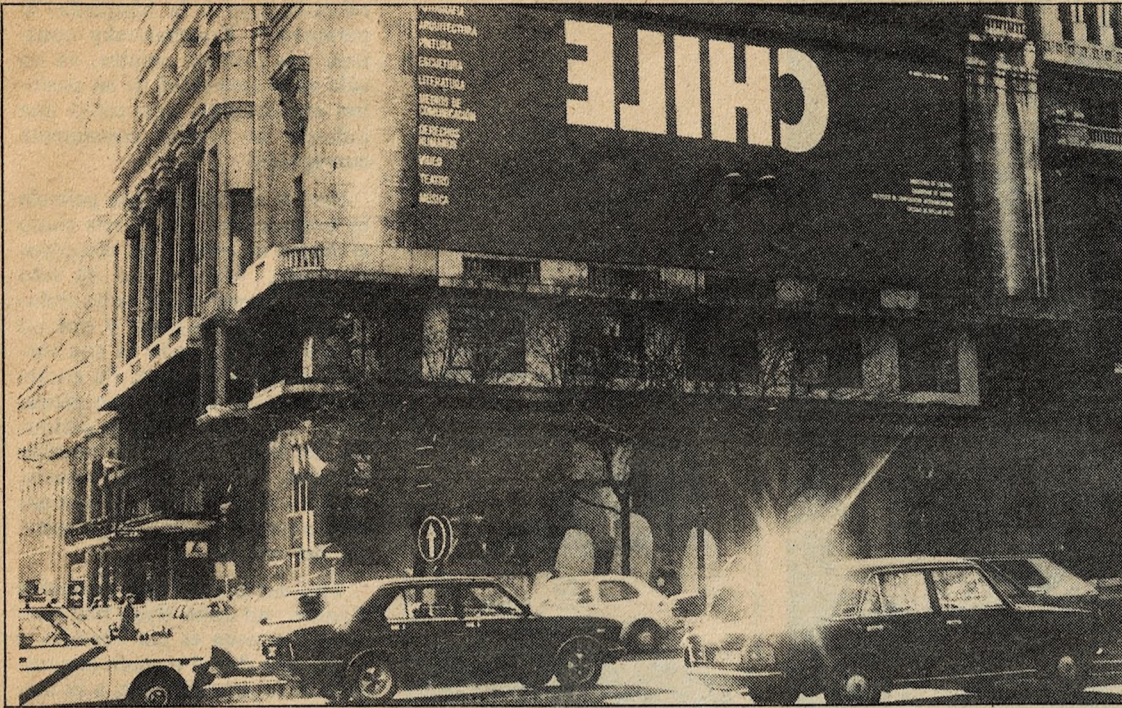
Círculo de Bellas Artes de Madrid: sede espectacular para la exposición