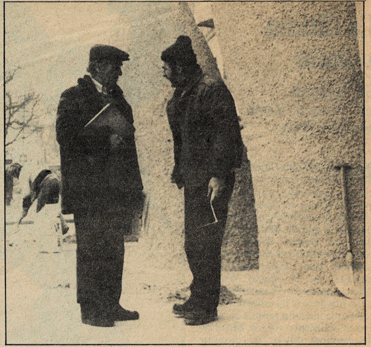
Nicanor Parra y Mario Irarrázabal, exponentes de la poesía y escultura chilenas admiradas por el público madrileño entre enero y febrero