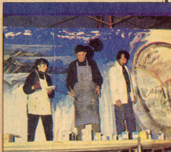
Nemesio Antúnez, en plena faena creadora, frente al público de Chile Crea.

—“Los chilenos tienen sus propios problemas. Y no son los míos. Yo estoy acá participando en un acto cultural