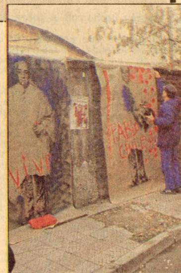
Neruda: el más homenajeado por chilenos y extranjeros.

con el cual me siento plenamente identificado”.