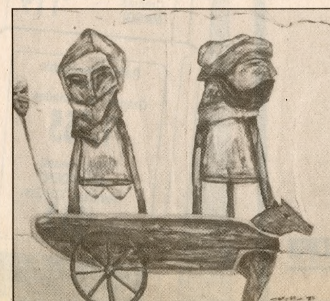
• Pintura de la muestra "El color del sur" que se exhibe en el Hotel El Araucano.

horas. Hotel El Araucano, exposición del concurso "El color del sur".