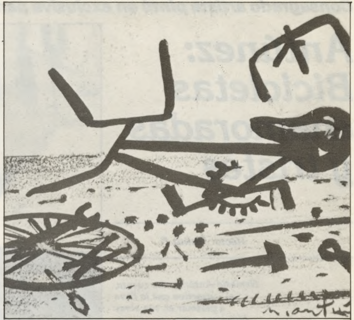
Bicicletas tristes, jóvenes, rotas, enamoradas, en la bullente imaginación del maestro Antúnez. Un regalo a nuestros lectores.

Yo escuché completo el Mundial del 62 y jugaba también como back centro".