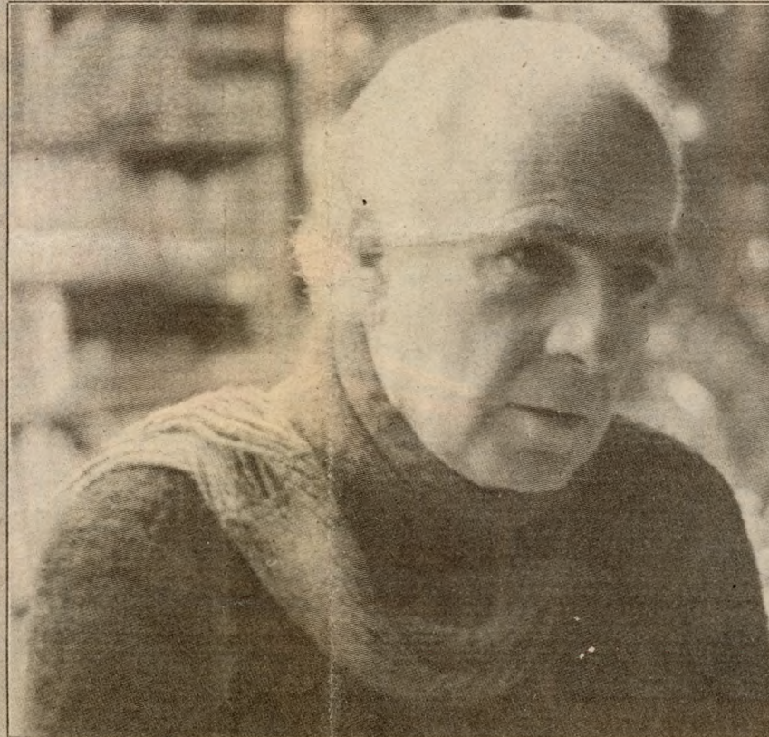
"El general habla del 10 de septiembre del 73, que fue funesto para la democracia. ¿Por qué no hablamos de los Alessandri, de Frei, del segundo gobierno de Ibáñez?" "El Consejo de Seguridad Nacional es todopoderoso, como el Padre Eterno".

—Al Estado no le interesa para nada, así que está privatizada la cultura