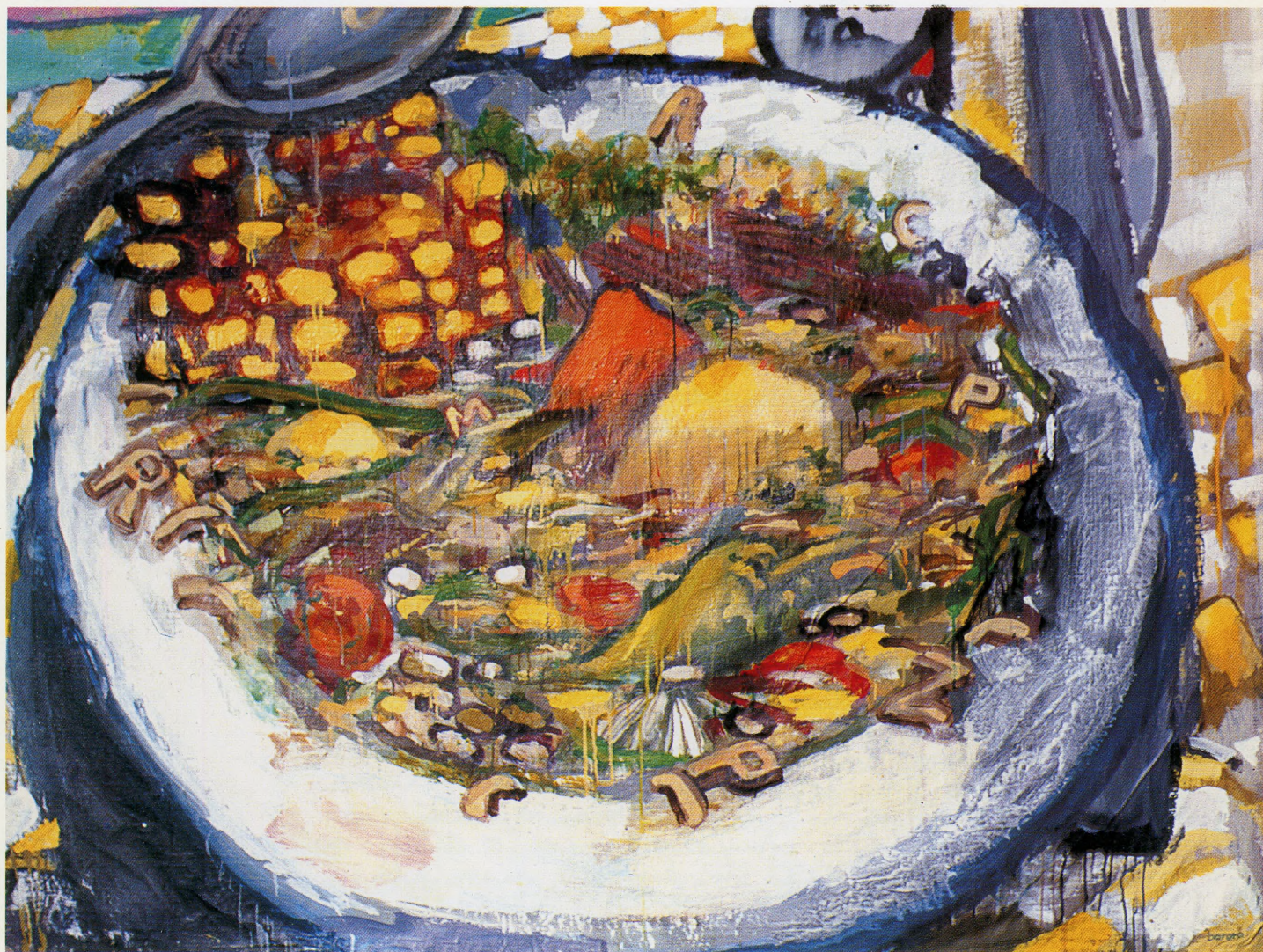
LA CAZUELA 1.89 x 1.50. Acrílico sobre tela.