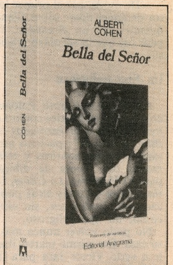
Quince semanas en las listas.

(Esta información es proporcionada por la Cámara Chilena del Libro A.G.)