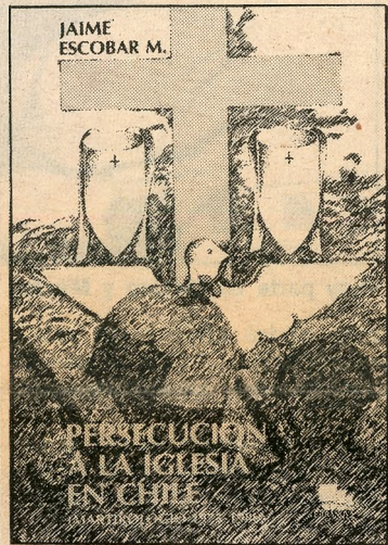
Publicó Terranova editores.