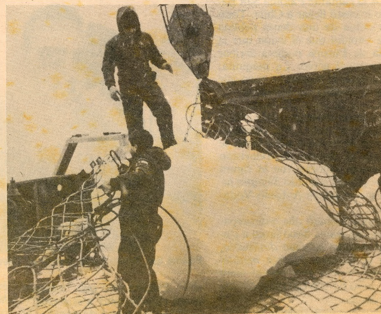
El iceberg chileno cuando fue "capturado", hace algunos meses.

Las lluvias caídas en los últimos días en España y el consiguiente aumento de la humedad en la Expo han hecho que el iceberg del pabellón de Chile se cubra de nieve.