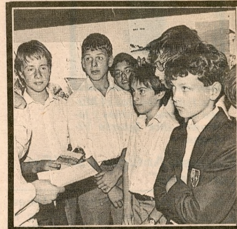
Un curso del Colegio Suizo se impresionó con "las bolsas de basura hechas arte, el mono arriba de la escalera, los colores y la forma de ver de Hodler y el tarot de Samy Benmayor".

Destaca el éxito de la exposición "Santiago, un nombre para el arte", que se expone actualmente y que muestra los mejores trabajos de los 2 mil 200 que concursaron en la convocatoria del Banco de Santiago. También el público ha hecho de esta muestra una de sus favoritas.