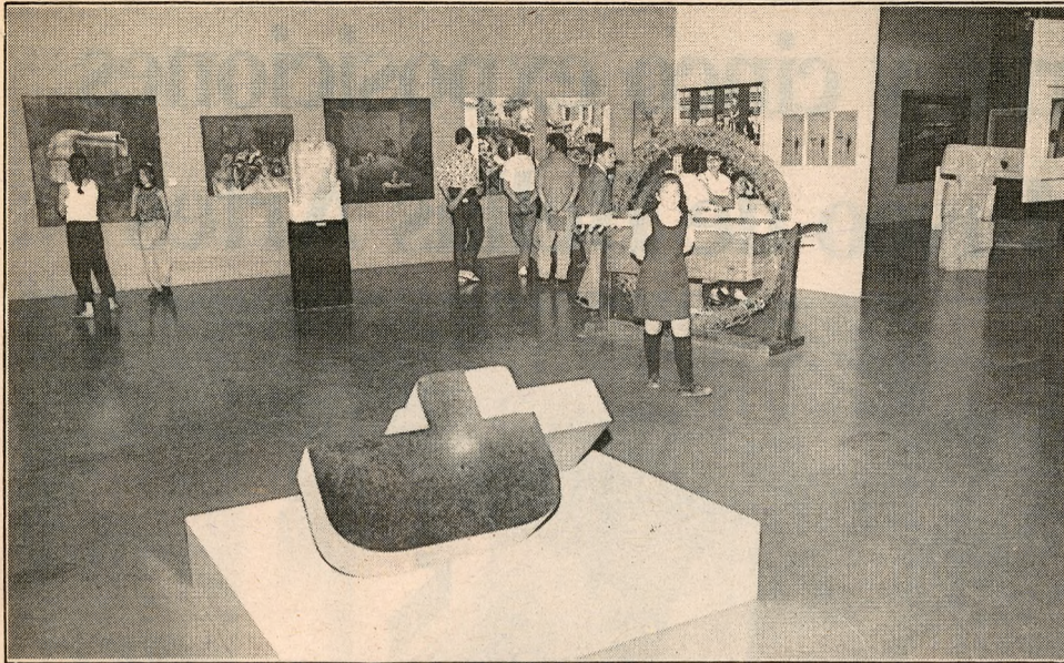
Los trabajos más destacados del concurso "Santiago, un nombre para el arte", reúnen trabajos de grandes artistas y de jóvenes valores.

La exposición de Ferdinand Hodler cuenta con un gran respaldo de la empresa privada. Los más pequeños reciben un material para colorear y anotar sus impresiones.