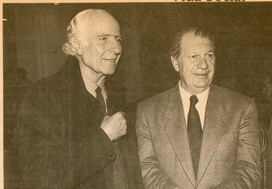
El Director del Museo de Bellas Artes, Nemesio Antúnez, y el Ministro de Educación, Ricardo Lagos.