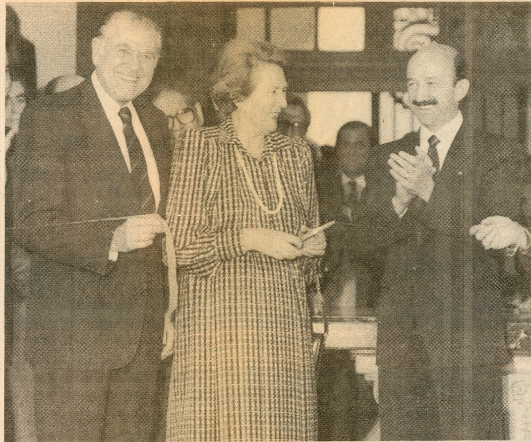
El Presidente de la República, señor Patricio Aylwin; señora Leonor Oyarzún de Aylwin, y el Presidente de México, Carlos Salinas de Gortari.