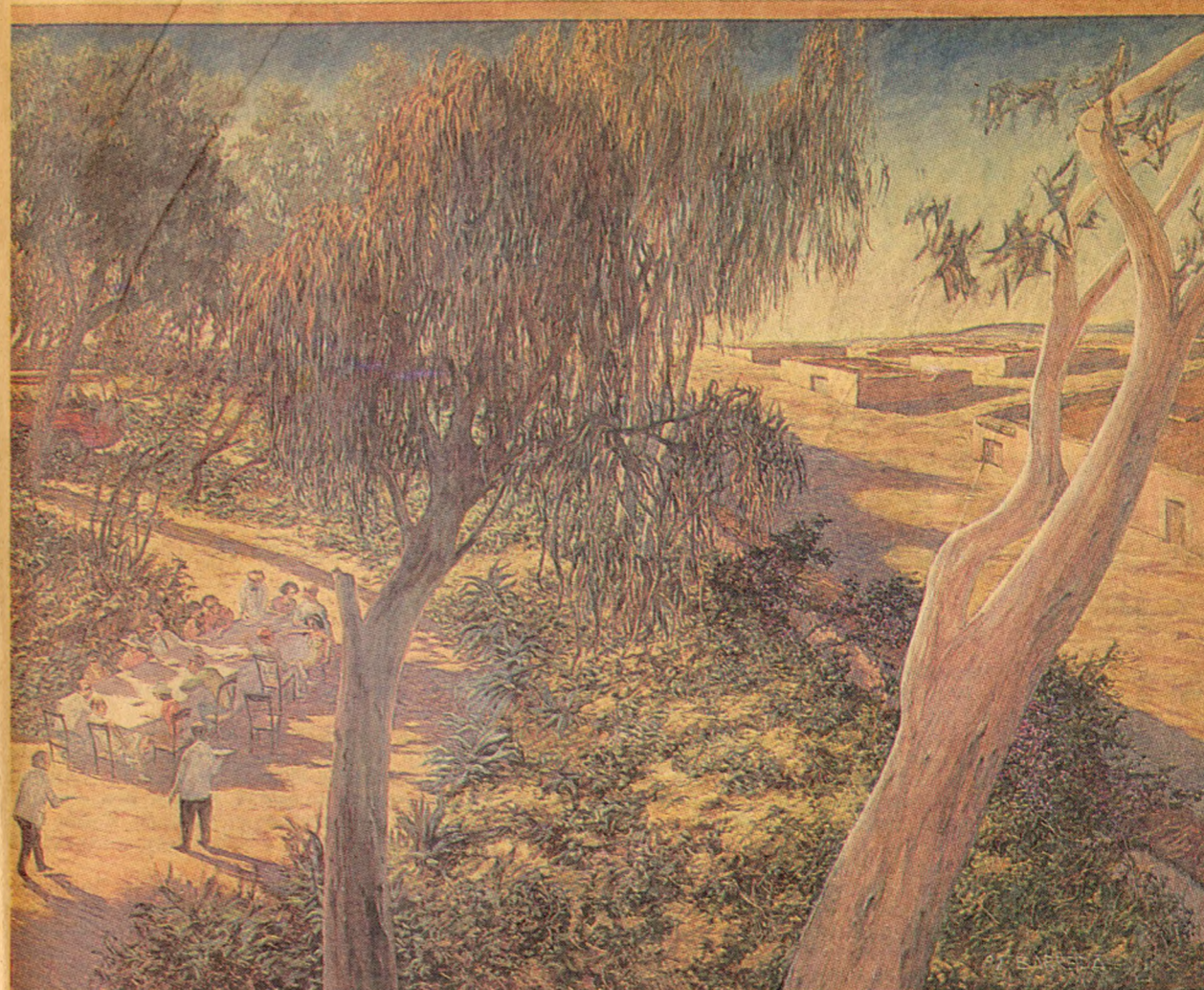
"City Tours", por Ernesto Barreda.