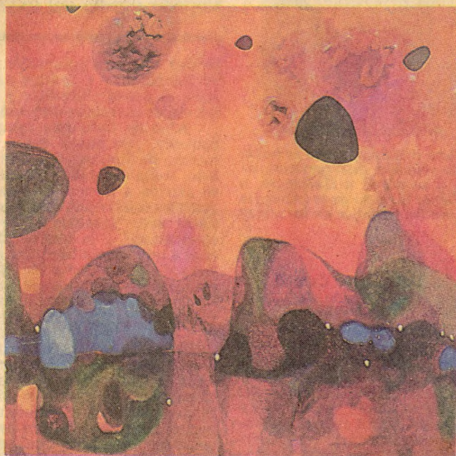
"Volcanes marinos", por Nemesio Antúnez.