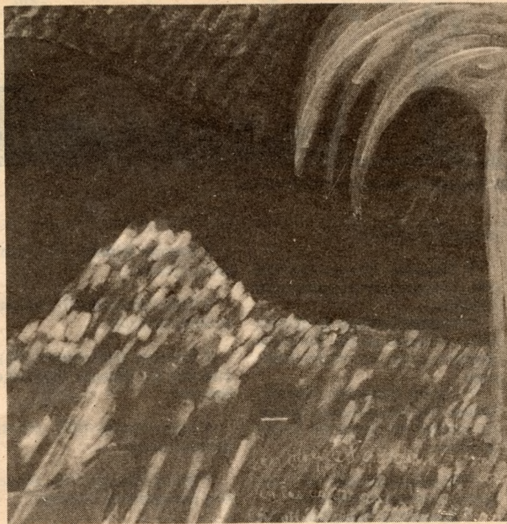
"De la serie del descubrimiento de América" de Patricia Figueroa.