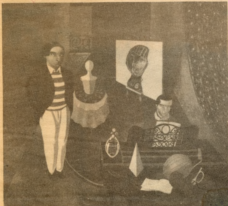
"Piano azul" de Gonzalo Cienfuegos.