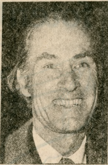
Ambassadör Harald Edelstam fick en tavla av landsflyktiga chilener som tack för hans insatser för de förföljda i Chile.