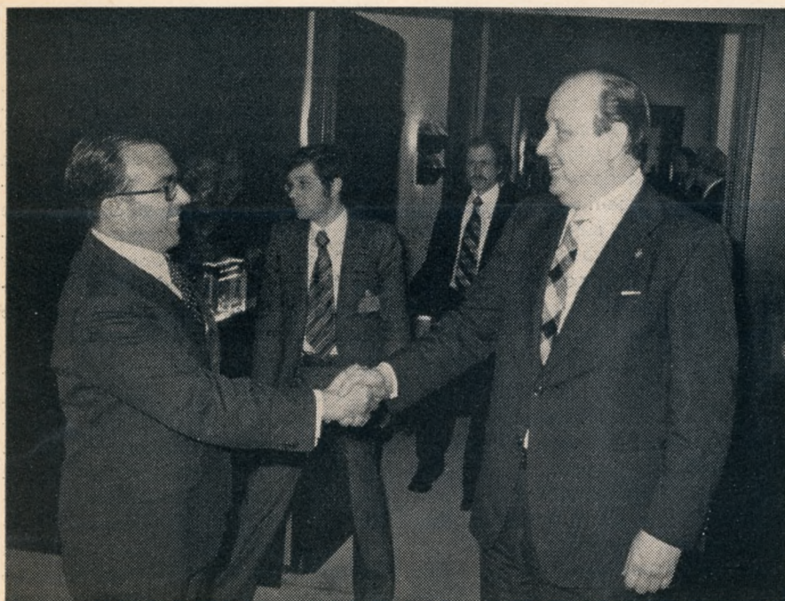
El ministro federal de Relaciones Exteriores, Hans-Dietrich Genscher (derecha), saluda a su colega español, Marcelino Oreja Aguirre

Desde la estipulación del convenio nuclear entre Bonn y Brasilia en junio de 1976 ha experimentado un considerable aumento el interés de los brasileños por la literatura especializada alemana y los cursos de alemán. El Instituto Goethe de Río de Janeiro organizó el año pasado cursos especiales de alemán para técnicos que se trasladan a Alemania. En las librerías se solicitan cada vez en mayor medida libros técnicos en alemán.