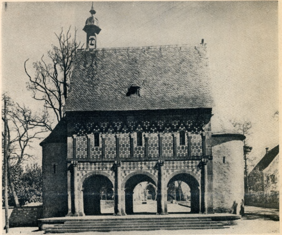
El palacete de Carlomagno, construido en 774, el más antiguo monumento que se conserva completo en la República Federal de Alemania, podrá ser salvado de la ruina. Próximamente se comenzará la construcción de una carretera de desvío, a fin de evitar los graves daños de la contaminación automovilística

El Instituto da actualmente empleo a 72 científicos. 23 de ellos realizan trabajos en el extranjero, también en aquellos países donde no existen delegaciones. La de Roma, por ejemplo, extiende también sus actividades a