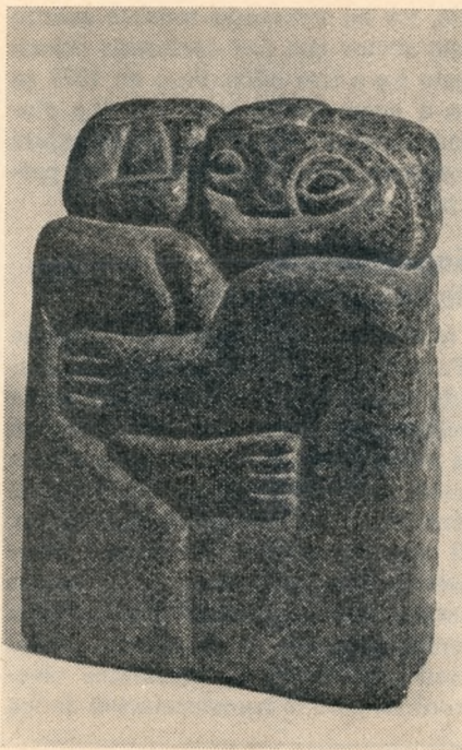
"Los amantes", 1968, granito, de Germán Becerra

El colombiano Germán Becerra, que ha cursado estudios en Roma y en la