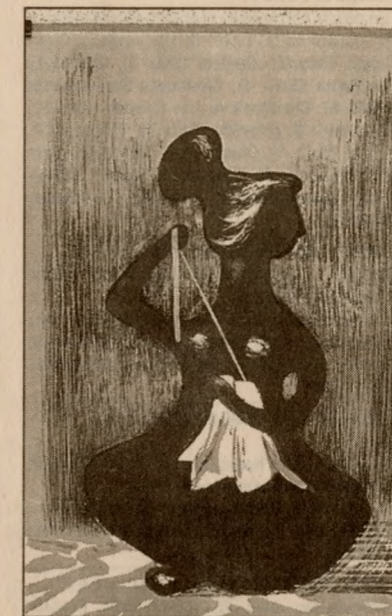
Una de la obras que se exhibirán.

nos colores. Nemesio aportó porque permitió levantar el nivel del grabado, el cual ocupó un lugar importante en Sudamérica".