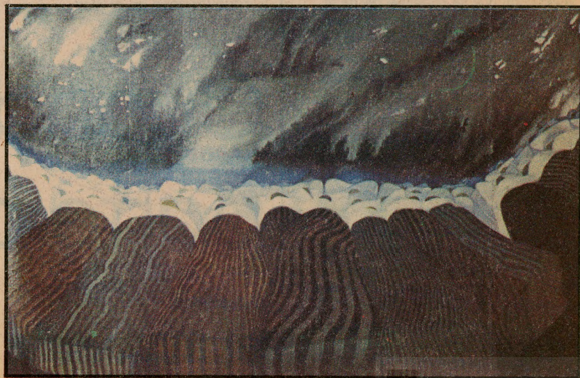
Las camas de Nemesio Antúnez: un motivo donde la pintura se torna acción, filosofía y nostalgias, poesía y sensualidad pura.