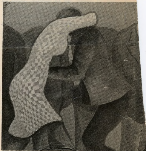
“Parejas” al óleo de Nemesio Antúnez.

Uno esculpe en metal y el otro —ella— esculpe en papier maché, realizando una artesanía que en realidad es arte; uno pinta con talento reconocido internacionalmente, y el otro —ella de nuevo— realiza tejidos no tan internacionalizados, pero excelentes; uno es pintor relevante residente en Nueva York a partir de una beca que le fue concedida por sus talentos y el otro —ella— parte artesanalmente y asciende como un rayo en el cielo norteamericano, exponiendo y vendiendo más y mejor que su compañero.